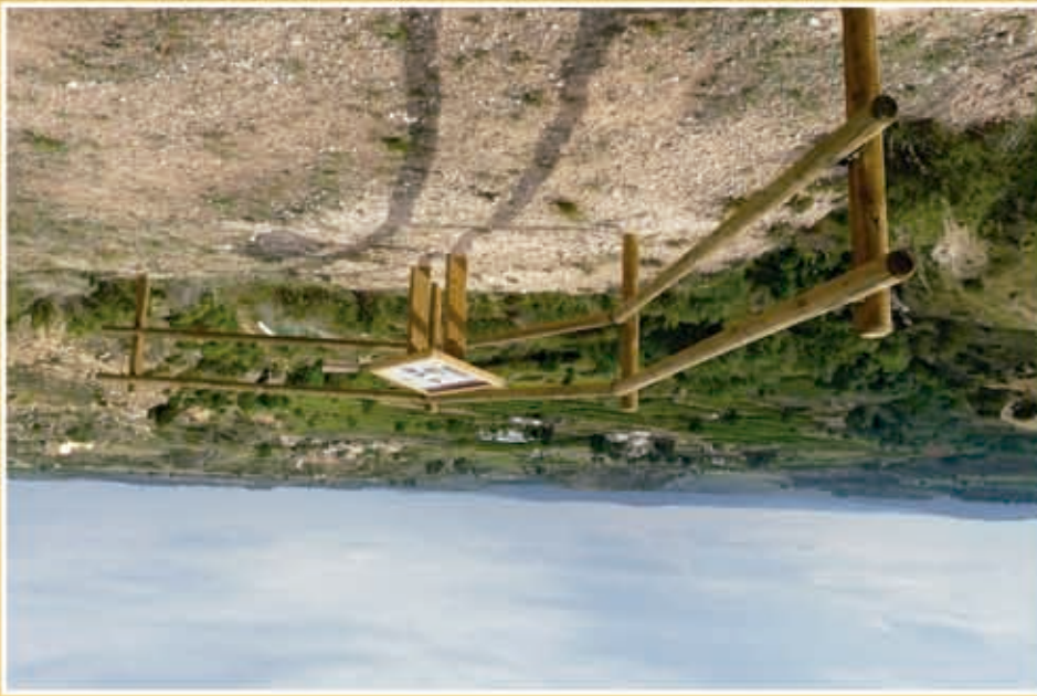
Antigua Municipal de 1918