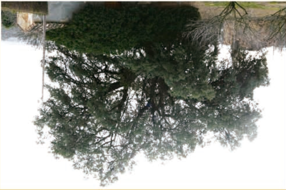
Cruz del Capellán