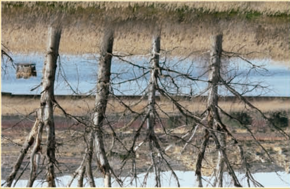
Baños de Fonté.