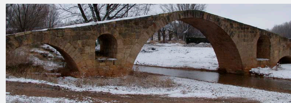
Puente romano en Luco

Seguimos rodeando el pantano y llegamos a la ermita de la Virgen del Rosario junto al interesante puente romano de Luco, lugar donde se cruzan los ríos Pancrudo y Jiloca, de ahí siguiendo el cauce del Jiloca podemos llegar a Calamocha.