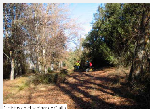
Ciclistas en el sabinar de Olalla

Siguiendo la ruta principal llegamos al impresionante sabinar de Olalla, cientos de sabinas centenarias, nos acompañarán a lo largo de una rambla que abandonamos a pocos metros de Olalla.