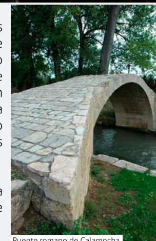
Puente romano de Calamocha

Además de probar el jamón hay que visitar las casas solariegas repartidas por el centro de la villa y el puente romano, uno de los emblemas de la localidad. En cuanto a la arquitectura religiosa sobresale por encima de todas, la iglesia parroquial de Santa María La Mayor, con su espectacular fachada retablo y su baldaquino. La ermita del Santo Cristo, la de San Roque y el convento de San Miguel Arcángel completan las manifestaciones de dicha arquitectura.