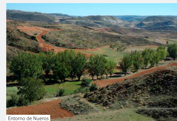
Entorno de Nueros

Dejamos el santuario a la izquierda y continuamos por la cresta de la sierra hasta descender por un barranco a la rambla de Nueros, dependiendo de la época del año y de la pluviometría cruzaremos varias veces la rambla con mayor o menor caudal.