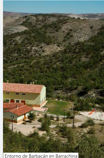
Entorno de Barbacán en Barrachina

Desde lo alto de esta vertiente del valle, podemos hacer una bajada opcional hacia el Pancrudo pasando por la Fuente Estud o realizar una variante del recorrido para visitar el Sabinar de Navarrete. Estas dos opciones nos llevarán de nuevo a Navarrete donde tenemos la opción de llegar hasta Lechago.