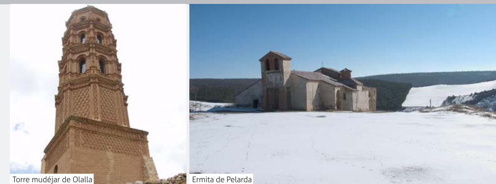
Torre mudéjar de Olalla

Comenzamos la subida por el camino de Bea, bajamos a la carretera e iniciamos la subida hacia la ermita de Pelarda.