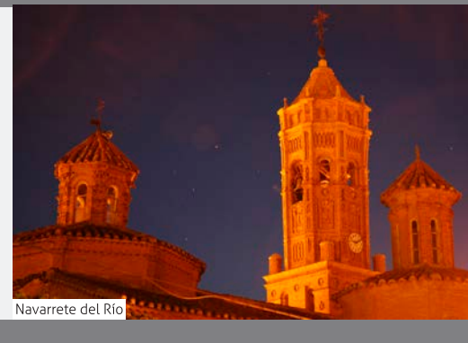
Navarrete del Río

Salimos del pueblo, abandonamos el asfalto y nos introducimos entre chopos cabeceros en la rambla de Cutanda.