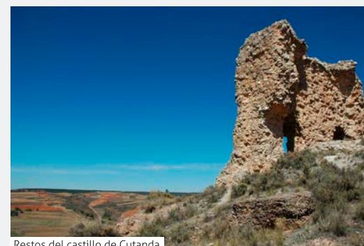
Restos del castillo de Cutanda

El peirón que encontramos a la salida del pueblo dirección Olalla, es uno de los más hermosos de toda la Comarca.